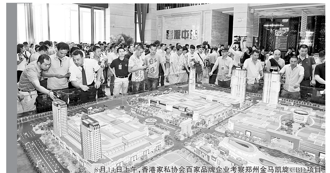
8月14日上午,香港家私协会百家品牌企业考察郑州金马凯旋CBD项目

最后,价值使命新。价值形态是利益关系者共赢平台,即为消费者创造美好生活,为合作伙伴创造共赢机遇,为股东创造丰厚利润,为员工创造发展前途,为社会创造和谐繁荣;基本使命是创新城市与家庭幸福指数,即以创新经营模式为产业品牌搭建共赢共享的发展平台,带来区域经济的长足发展,并对城市结构的优化、城市功能和品质的提升提供强大示范效应,进而直接惠及亿万家居消费者,实现美好生活的梦想。