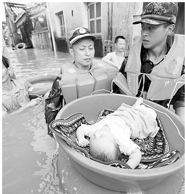
8月18日,在广东省普宁市陇镇下寨村,救灾人员在转移受困群众。

新华社沈阳8月19日电 记者从辽宁省防汛抗旱指挥部了解到,15日至17日的超强降雨使抚顺流域内河流洪水暴涨,在短时间内迅速淹没和冲毁村庄房屋,铁路、公路、供电、通信等全部中断。截至19日5时,抚顺市已有54人因洪灾死亡。