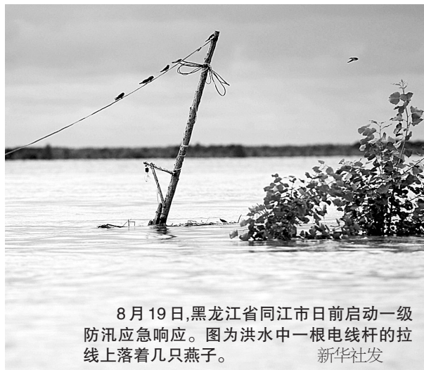
8月19日,黑龙江省同江市日前启动一级防汛应急响应。图为洪水中一根电线杆的拉线上落着几只燕子。

根据习近平指示和李克强要求,国务院已紧急派出以民政部副部长姜力为组长,水利部、发展改革委、财政部、国土资源部、交通运输部、卫生计生委等有关部门同志组成的国务院工作组,赶赴辽宁抚顺洪涝灾区,指导帮助开展抗洪救灾和抢险救援工作。国家防汛抗旱总指挥部已派出多个工作组、专家组赴嫩江、松花江、黑龙江防汛抗洪一线检查指导,并及时调拨抢险物资予以支持。