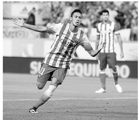
8月21日,巴萨队球员内马尔庆祝进球。当日,在西班牙超级杯赛首回合比赛中,巴塞罗那队客场以1:1战平马德里竞技队。

本轮形势一片大好的深圳红钻,自从被建业击败之后一蹶不振,上轮以1:3不敌重庆力帆,吃到了近6个客场比赛里的第5场败仗,让深足本赛季的输球数达到了8场,本轮尽管占有主场优势,但面对近况颇佳的天津松江,“白巫师”特鲁西埃统领的深圳红钻也不敢轻言必胜。 本报记者 刘超峰