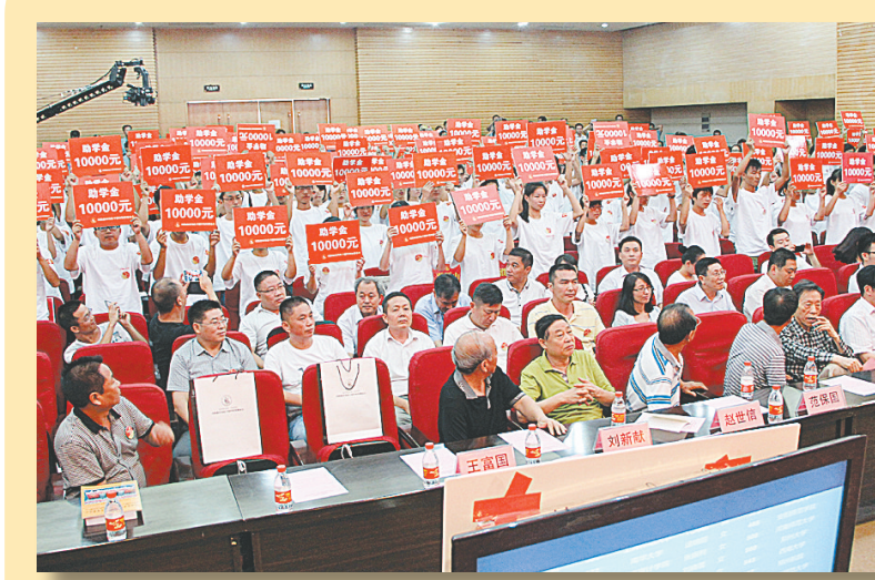
8月18日,第四届宋河老子国学教育基金会“传递爱·让梦想飞翔”百万助学活动在郑举行,出资204万元资助省内18个地市的204名寒门学子。据悉,在204名受资助学生中,孤儿家庭学生26名,单亲家庭学生65名,残疾人家庭学生24名,其他特困生89名。