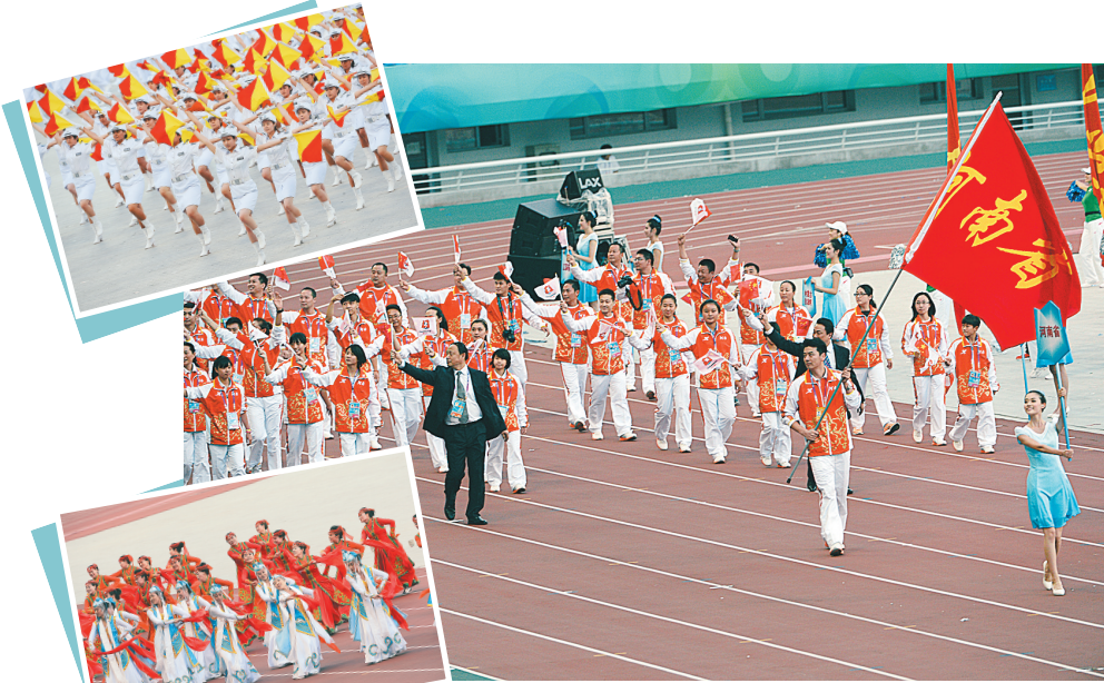
全运会开幕式即景。

有外媒认为,被誉为“小奥运会”的全运会节俭举办,证明中国正在进行的破除“四风”活动效果显著,会为今后全运会及其他大型活动怎么办提供了指引。