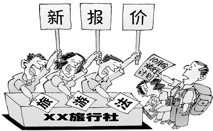
“暴”价 蒋跃新作

本报讯(记者 成燕)“十一”黄金周堪称一年旅游最旺季,尤其以出境游、长线游最为火爆。然而,今年由于《旅游法》将于10月1日起正式实施,届时,流行多年的“零负团费”、强制购物等旅游“潜规则”将被明令禁止。记者昨日从省会多家旅行社了解到,随着部分旅游地接待费用将上涨,今年“十一”长假境内外出旅游线路预计将全线上涨,由此引发的是省会旅行社行业从拼价格转为拼服务。