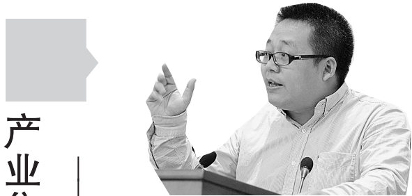
——访中国城市发展战略研究会副会长易鹏

融合、务实招商等问题,不少专家学者建议,地方政府应努力打造公平、公正、公开的服务产业集聚区建设体系,在建设产业集聚区时,注重配套建设教育、卫生等公共服务设施,最大程度实现产城融合。在招商引资方面,应多开展产业链、小分队招商,深入挖掘产业链上下游资源,根据地方经济特色实现科学务实招商。