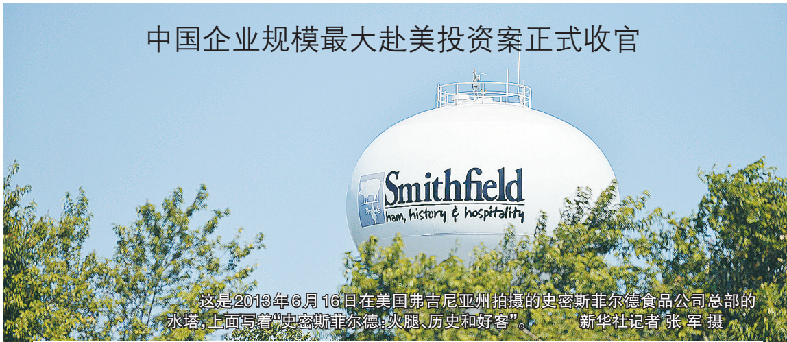
这是2013年6月16日在美国弗吉尼亚州拍摄的史密斯菲尔德食品公司总部的永塔,上面写着“史密斯菲尔德:火腿、历史和好客”。

据新华社华盛顿9月26日电(记者王宗凯 高攀)中国双汇国际与美国史密斯菲尔德食品公司26日联合宣布收购完成,至此中国企业规模最大的赴美投资案正式收官。