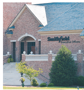
这是2013年6月16日在美国弗吉尼亚州史密斯菲尔德食品公司总部外景。

双汇国际为收购股份将支付47亿美元,此外还将承担史密斯菲尔德24亿美元的债务,总收购金额高达71亿美元。这是迄今中国企业规模最大的赴美投资案,也是继去年万达收购AMC后中国企业赴美投资的又一里程碑。