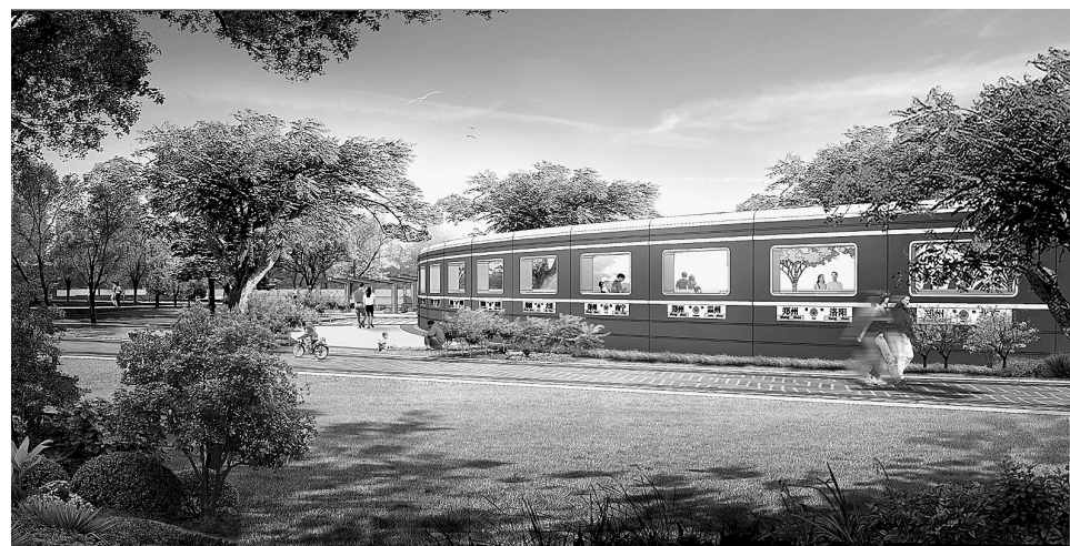
郑开大道生态廊道景观方案铁路效果图。

本报讯(记者 卢文军 通讯员 王丽 孟飞龙 文/图)记者昨日从中牟绿博文化产业园区管委会获悉,围绕郑开大道生态廊道景观方案,表现“奔跑的中原”的理念,园区根据自身区位特点,邀请北京北林地景园林规划设计院,提炼“豫剧”、“铁路”、“纺织”、“农业”四个主题,对郑开大道生态廊道(绿博段)景观方案进行深化设计。