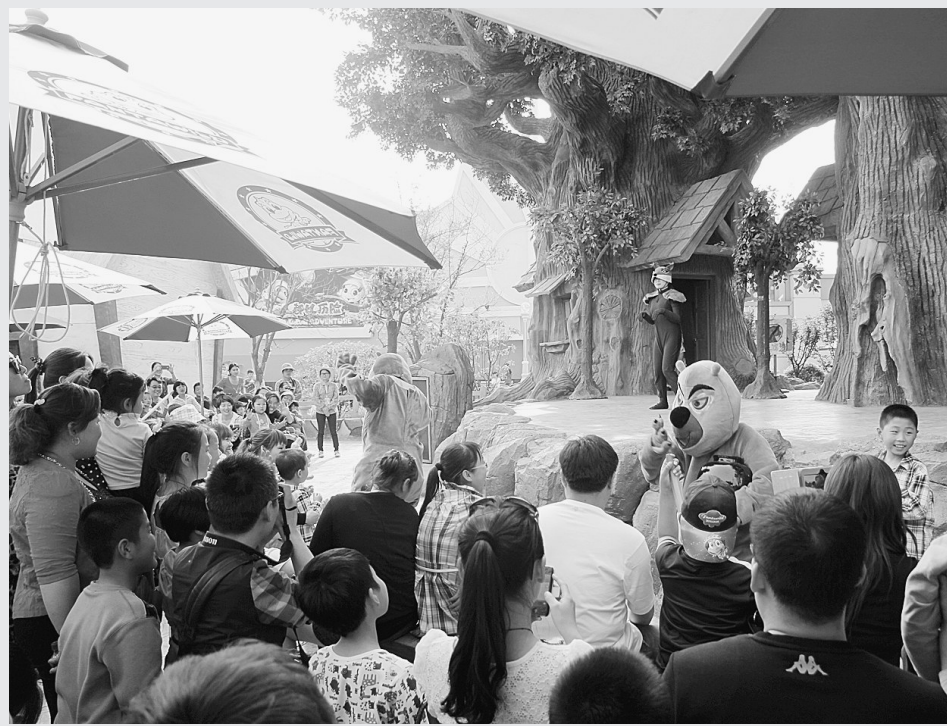
华强郑州方特欢乐世界的熊出没卡通剧吸引了大量游客。

“十一”黄金周期间,康百万庄园推出民俗文化、明清真人秀实景演出,吸引众多游客纷至沓来。杜甫故里景区举办名人字画展,浮戏山雪花洞则推出溶洞地质游、古寨红叶游,杨树沟景区推出第四届金柿采摘节等活动,引得众多游客陶醉其中。假日期间,该市旅游市场秩序井然。