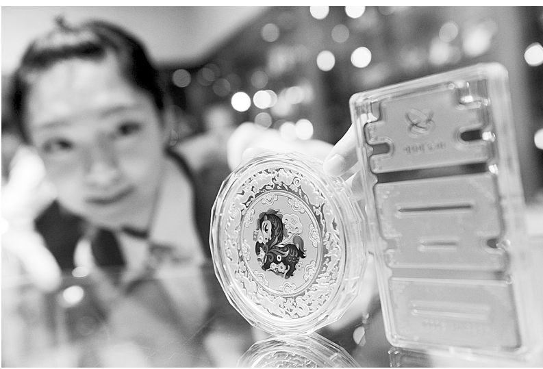
10月16日,由中国金币总公司发行的“马年生肖纪念章”在北京上市。纪念章分别采用金、银、铜材质制作,形制分为喜字形、圆形,共计16个品种。

据中国拍卖行业协会会长张延华介绍,成立后的中拍协机动车拍卖专业委员会,工作内容包括规划行业发展、推进标准化服务、培育专业人才、争取积极扶持政策等。