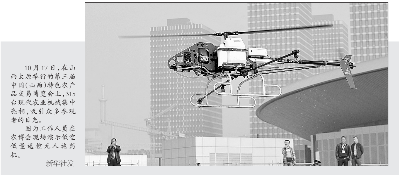
10月17日,在山西太原举行的第三届中国(山西)特色农产品交易博览会上,315台现代农业机械集中亮相,吸引了众多参观者的目光。图为工作人员在农博会现场演示低空微量遥控无人施药机。

即日起,持币待购读者可编辑意向车型名称+征集令,发送至郑州日报汽车部微信公众平台,或通过短信发送至18638131715,即有机会与专业人士一起进行现场意向车型的对比评测。(苏立萌)