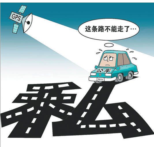
不敢“走私”了 朱慧卿作

曝光、公示、监控——种种“药方”对于沉疴已久的公车腐败现象,能否奏效,公车改革这个“大手术”将如何有效推进?