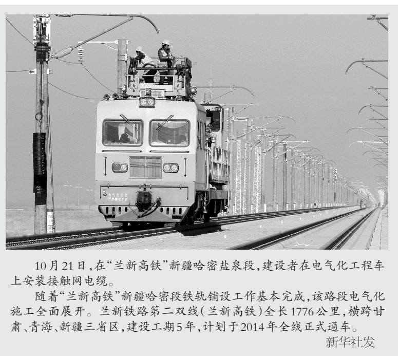
10月21日,在“兰新高铁”新疆哈密盐泉段,建设者在电气化工程车上安装接触网电缆。随着“兰新高铁”新疆哈密段铁轨铺设工作基本完成,该路段电气化施工全面展开。兰新铁路第二双线(兰新高铁)全长1776公里,横跨甘肃、青海、新疆三省区,建设工期5年,计划于2014年全线正式通车。