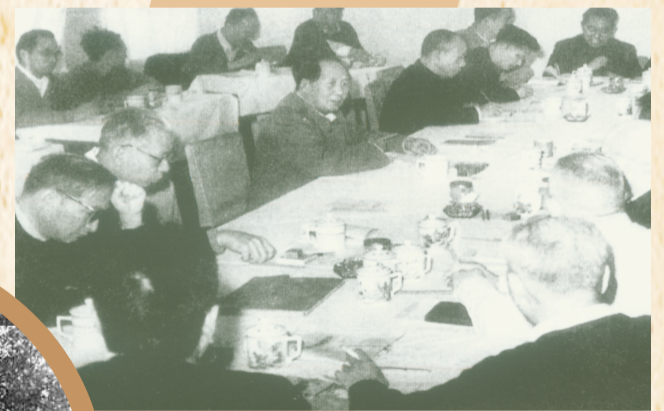
1958年11月2日至10日,中共中央工作会议在郑州召开(即第一次郑州会议),会议开始着手纠正公社化运动中存在的一些“左”的错误。