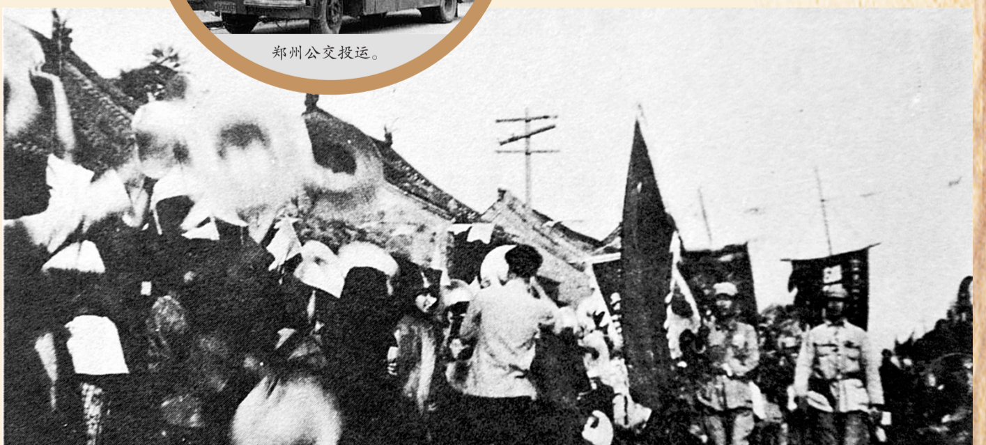
各界群众欢迎解放军进入郑州。