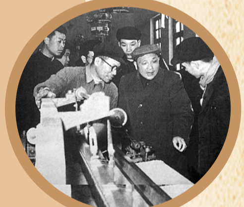
1960年2月18日,邓小平同志视察郑州四棉研制的喷气织机。