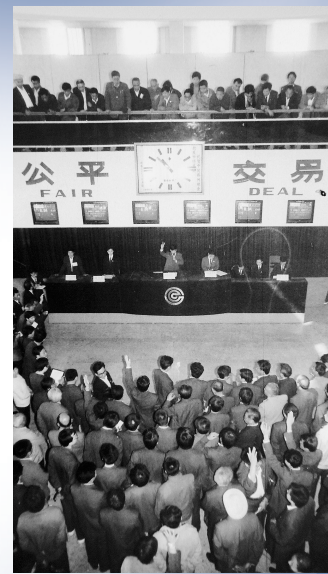
中国郑州粮食批发市场