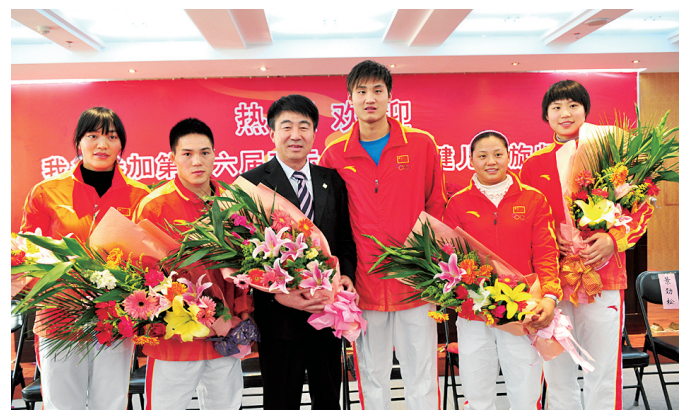
郑州市体育局局长李庆山欢迎亚运会郑州籍健儿凯旋