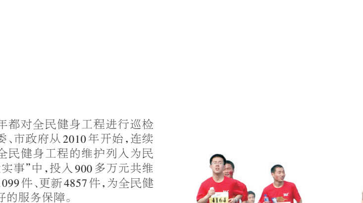
全民健身展示大赛