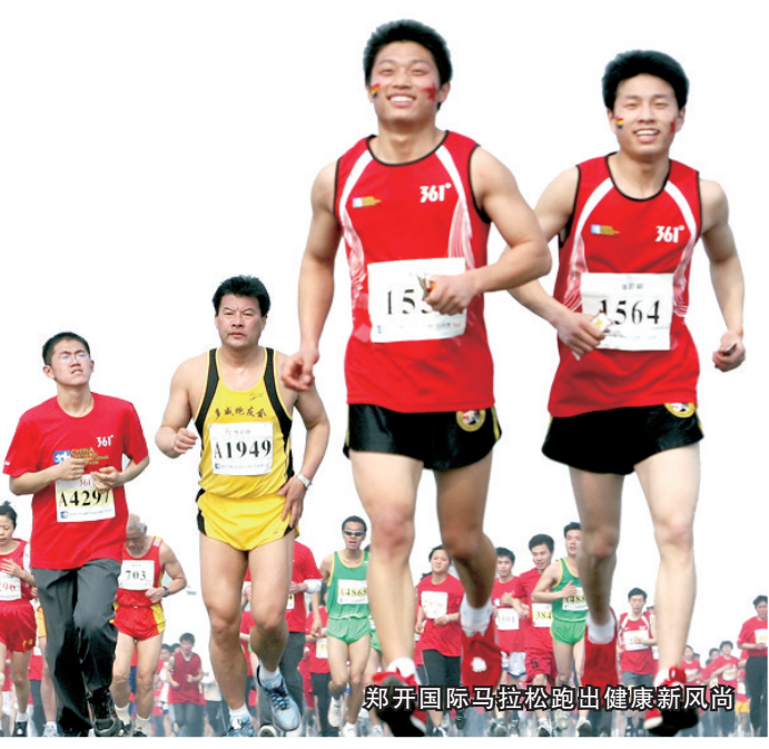
郑开国际马拉松跑出健康新风尚