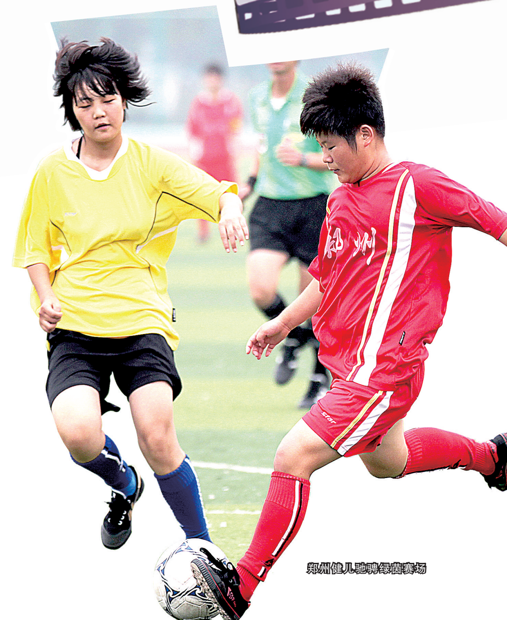
郑州健儿地鸣响绿茵场

2012年第九届中国郑州国际少林武术节，先后邀请到56个国家和地区、142个团队、1160人参赛。本着“环境优美、设施优良、服务优质、交通方便”的原则，高标准做好接待工作，保证了赛事的需要。作为东道主，我市代表团共获得23个一等奖、10个二等奖和6个三等奖，充分展示了武术之多的实力。 2012年第九届中国郑州国际少林武术节，共有来自73个国家和地区的195个团队、1527名运动员参赛，赛事规模和参赛人数、国家及地区数量均超过了第八届，再创历史新高。另外本届武术节内容丰富，形式新颖，让参赛的外国朋友充分领略了博大精深的中原文化，被国家武管中心主任高小军称赞为“最精彩的一次武术节”。 每年举办一届的中国郑州国际马拉松赛已经连续举办了七届，经过七年的耕耘，这项赛事已经成为国内最著名的马拉松赛事之一，影响力日益扩大。 去年和今年举行的世界斯诺克巡回赛郑州公开赛，为绿城带来了塞尔比、希金斯、丁俊晖、宾汉姆等世界明星，让绿城市民在家门口就能欣赏到世界顶级水平的斯诺克赛事。 实践证明，体育赛事尤其是规格高、规模大的体育赛事，已成为一个城市和地方富有特色的名片。经过郑州体育人的不懈努力，“郑州名片”已变得更亮、更响、更美。