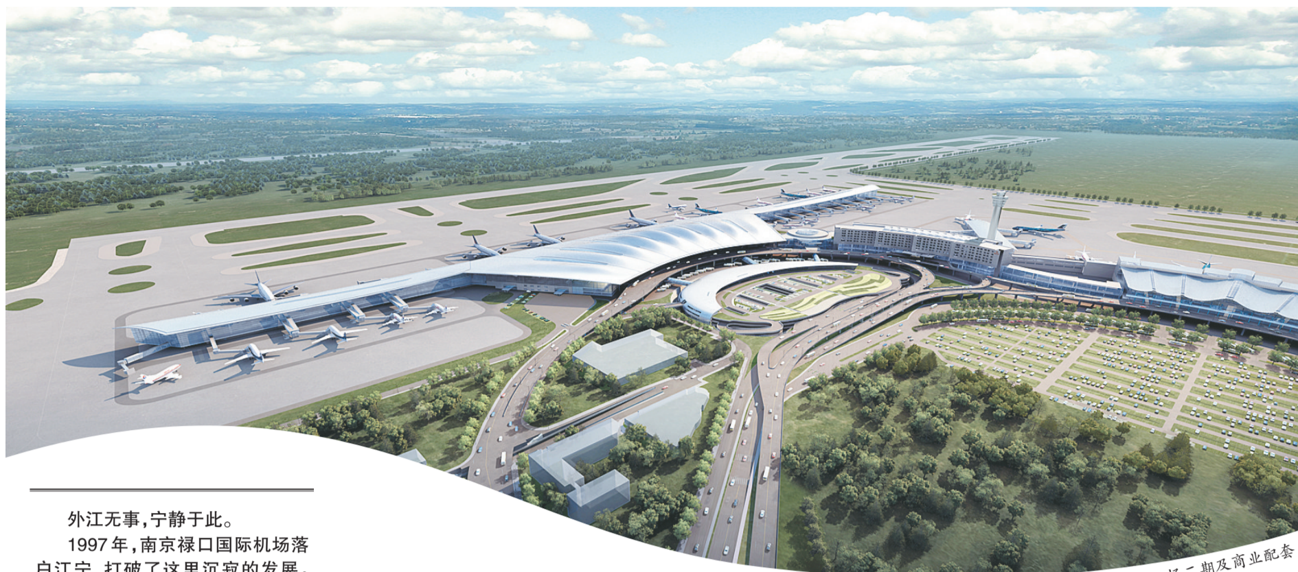
机场二期及商业配套