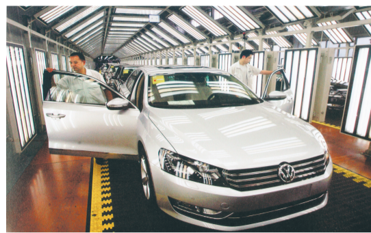
全新大众帕萨特轿车在江宁成功下线