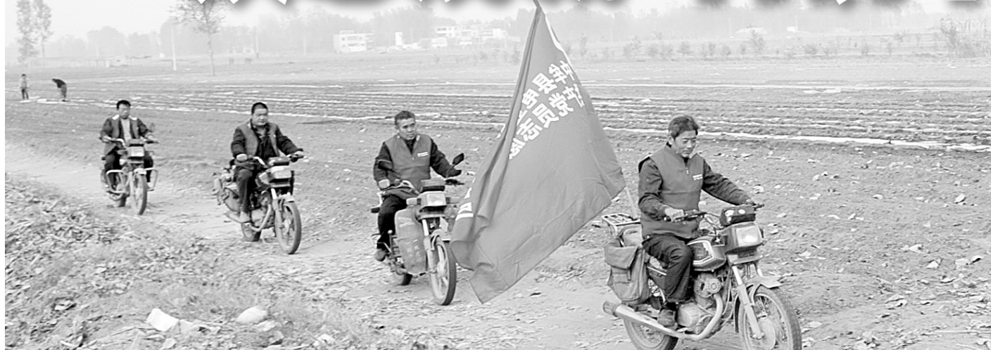
抗旱小分队奔赴田间地头，流动服务农业生产。