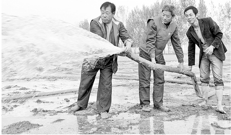
抗旱服务队帮助农民浇地。

中牟县电业局抗旱保电服务队深入田间地头,对用电设备、老化线路、触电保安器进行隐患排查,及时消除和整改;设立抗旱保电田间服务站,对农村排灌用电业务开通“绿色通道”,在最短的时间内架设临时供电设施;配备移动发电机,随时为农民解决排灌用电问题;服务队实行24小时轮班制,确保农民足墒下种。