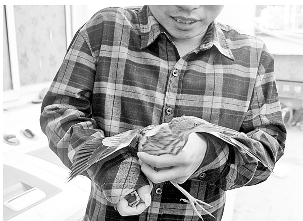
得到及时救治的小鸟恢复了生机。

现场,并将受伤的小鸟接到临时救助站进行救治。之后,经专业人士鉴定,确定受伤的小鸟为南方的一种候鸟,名为苇鸭,属国家二级保护动物。野生动物保护部门的工作人员表示,小苇鸭救治完毕、恢复飞行能力后,将及时对其进行放生。