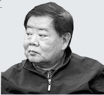
央人民广播电台原副总编辑 首届郑州新闻奖评委、中

很乐意接受郑州市委宣传部、郑州市记协之邀参加首届“郑州新闻奖”评选活动,从获奖的大量作品中,我真切地感受到了“大爱郑州”的正能量,报道郑州的新闻同行们坚持“走转改”,不断