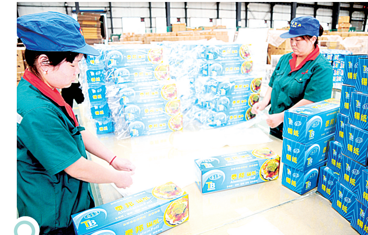
巩义传统企业的产品逐步走向终端化

“传统产业不是包袱,而是宝贵的资源。通过走‘高端化、终端化、高效益’之路,必须提升传统产业,应该是巩义实现经济发展的最实际、最有效的做法。”郑州市委常委、巩义市委书记舒庆指出。巩义加快传统产业转型升级,是责任,更是担当。煤铝铁硅是河南是巩义最基础的产业,要实现产业转型升级,必须坚持把传统产业作为转型升级最现实的资源。巩义的转型能否成功,同样也关系到河南的转型发展,为此,省委、省政府高度关注巩义转型升级,省委书记郭庚庆作出了争取走出一条路子、以在全省典型示范的重要批示;省长谢伏旺提出了巩义要做做传统产业转型升级的表率,进一步明确了巩义的责任担当。肩负着重大的历史使命,巩义紧紧围绕“高端化、终端化、高效益”产业转型升级方向,推动传统产业焕发新的活力和新的生机,努力走出一条路子,为全省转型发展做出重要贡献。