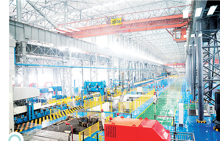
中孚实业已经成为巩义铝加工标志性企业

传统产业是巩义转型升级的基础和优势。“七山两水一分田”的巩义市是典型的传统工业城市,经过多年的发展,已形成了铝及铝精深加工、耐火材料、装备制造、煤炭电力、特钢、电线电缆、化工化纤、食品医药八大支柱产业。近年来,在看到经济总量领先的同时,巩义上下也清楚地意识到,巩义的产业层次还不够高,终端产品少,产业链短,技术装备水平有待提高,科技创新及高端人才缺乏等方面的不足,使得铝、耐材等传统产业成为经济发展的主要掣肘,产业转型升级成为经济发展不可回避的问题。