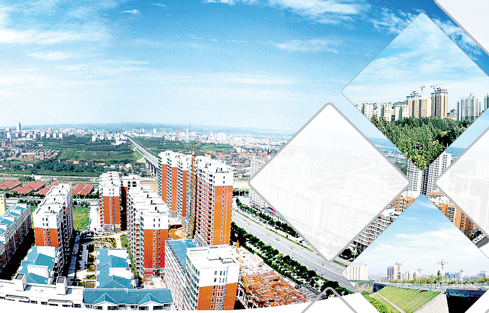
金汽配区,建筑面积约15万平方米,截至目前,一期一、二标段共21栋楼,建筑面积11万多平方米,主体全部完工,260多家商户已进场装修,10月28日开始试营业。

巩义的转型升级任重道远,全市上下正在充分利用经济危机倒逼机制,率先转型,坚定转型,全面推进产业、技术装备、管理方式和思维模式四个层次的转型,促进产业精细发展、高端发展、终端发展、融合发展,探索走好高端化、终端化、高效益的产业转型升级路子,为全省结构调整和产业升级做出应有的贡献。”舒庆这样说。