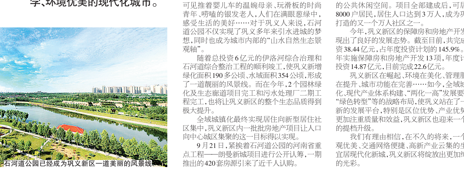
石河公园已经成为巩义新区一道美丽的风景线

我们有理由相信,在不久的将来,一个景观优美、交通网络便捷、高品质云集的生态宜居现代化新城,巩义新区将绽放出更加绚丽的光彩。