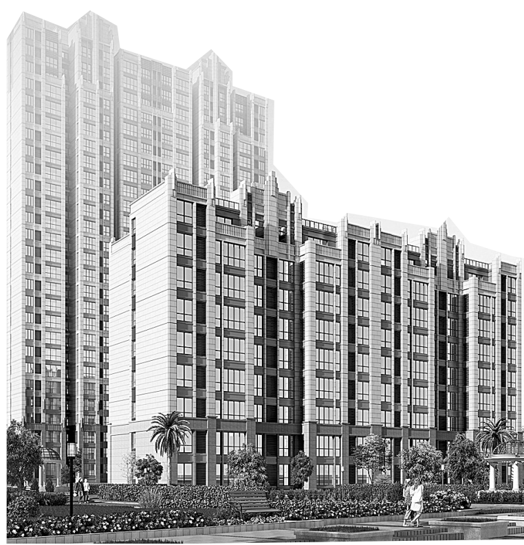
正商·书香华府效果图

从2013年郑州土地供应情况来看，龙子湖区域将来势必成为市场的竞争热点。现今CBD外环30栋写字楼良好的市场回报和投资追捧的情形有望在湖心岛再现，相对在郑东新区第一轮开发扩容的投资受益者而言，龙子湖的掘金宝地更无法错过。整个区域随着正商地产等多家实力开发企业的强势入市，将会给郑东新区以及整个郑州商务地产带来又一轮财富风暴。