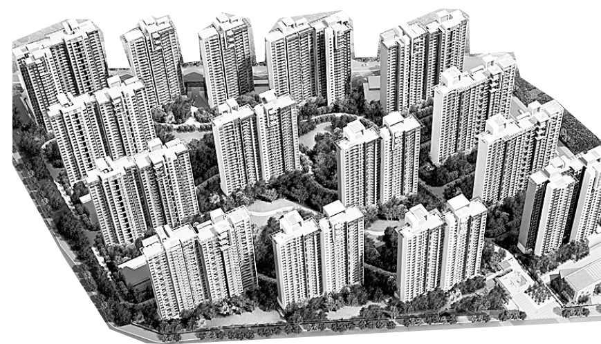
永威·五月花城项目鸟瞰图

真正的居住，应当是一个系统而有序的“有机集成生活系统”。漫步在气势恢宏的大学建筑间，感受儒雅的文化氛围，少了一份过度的城市化带来的浮躁，多了一份学院派的宁静与脱俗。分享郑东新区亿万价值配套，渗透龙子湖大学城多元价值基底，开启人文中心主义的时代。随着教育、医疗、文化、市政等服务设施逐步完善，凝聚城市精神灵魂的龙子湖区，人文地脉逐日凸显。正商·书香华府，无疑是龙子湖大学城第一拨受益者，也是最具投资价值与升值潜力的优质资产。