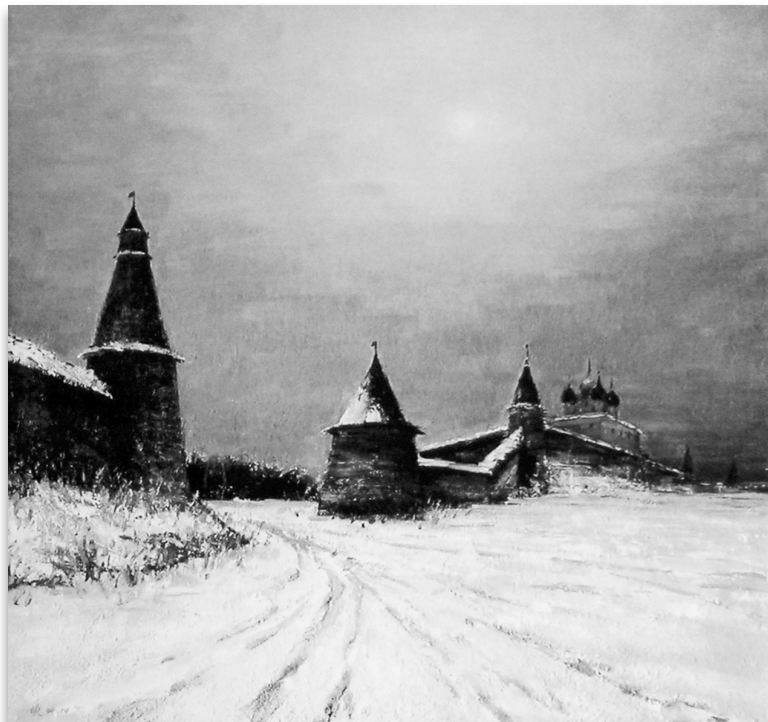
普斯科夫十二月(国画) 刘晓

边塞诗的再次兴起是新中国成立以后。随着新疆开发事业的高潮，不少诗人来到新疆，创作了大批边塞诗作。闻捷的《天山牧歌》《复仇的火焰》标志着新边塞诗的崛起。1960年，著名诗人郭小川到新疆深入生活，正式提出“新边塞诗”的主张。时期的诗作主要有：《西出阳关》《雪满天山路》及贺敬之的《西去列车的窗口》、张志民的《西行剪影》等力作。同一时期，诗坛泰斗艾青到了新疆，创作了大批边塞诗作。从此，边塞诗的马蹄奔驰在新疆的崇山峻岭、戈壁沙丘，从未停止过步伐。