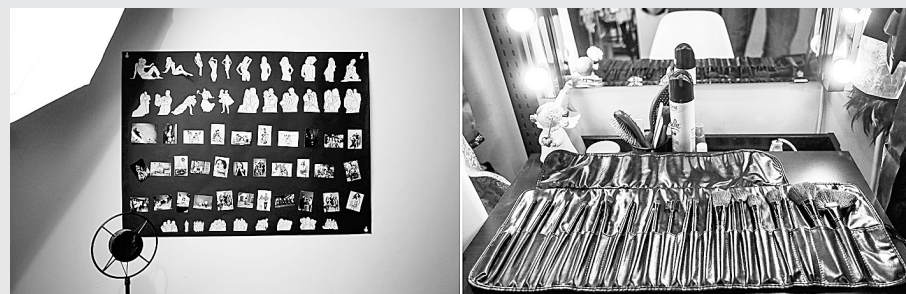
左上图:创业者崔颖馨从国外亲自挑选,定制了一批特色服装。 左下图:这是自拍摄影棚内指导拍摄者摆姿势的指南(11月10日摄)。该指南有助于拍摄者寻找创意,缓解紧张情绪,迅速进入拍摄状态。 右下图:这是自拍照相馆准备的化妆用具(11月10日摄)。 右上图:11月10日,一名自拍者在影棚内手持遥控器准备自拍。