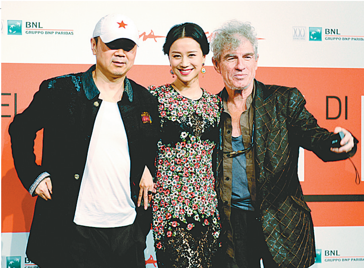
崔健(左)携倪虹洁、杜可风亮相罗马电影节

周虹告诉记者,近几日津豫双方的艺术家们一直在联合排练,双方已经建立起了基本的默契,“这场弦乐重奏音乐会上,两地的艺术家们同台演出,这对于双方都是一次难得的交流展示和提升的机会。”