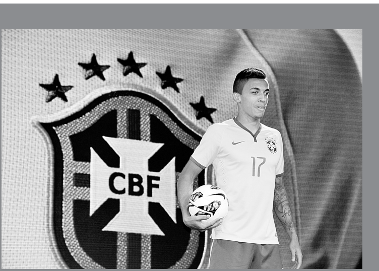
11月24日,巴西国家队球员古斯塔沃在发布仪式上展示新球衣。当日,巴西国家足球队征战2014年世界杯的新款球衣发布仪式在巴西里约热内卢举行。