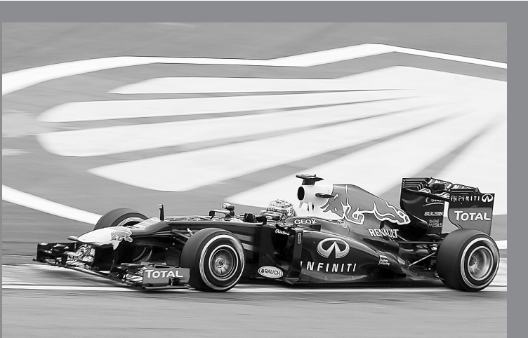
11月24日,红牛车队车手维泰尔在比赛中。当日,2013年世界一级方程式(F1)大奖赛最后一站——巴西站在圣保罗拉特拉斯赛道进行,最终红牛车队车手维泰尔获得本站比赛冠军,他的队友韦伯获得亚军,法拉利车手阿隆索获得季军。