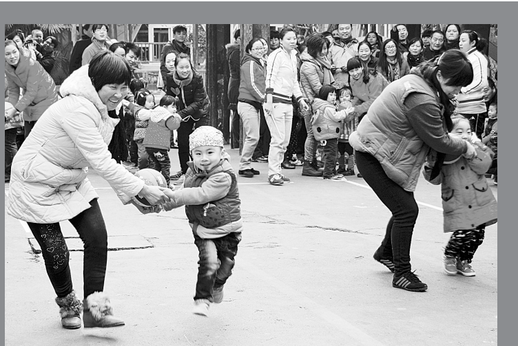
日前,河南省商务厅二幼举行秋季运动会。图为亲子“螃蟹排球”比赛。