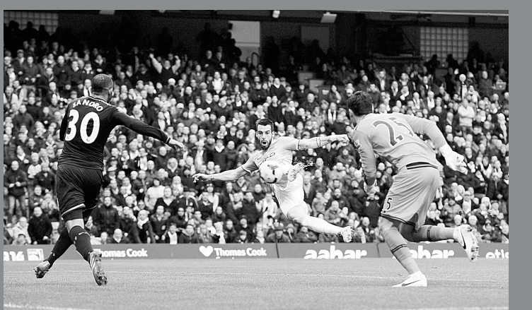
11月24日,曼城队球员内格雷多(中)射门得分。当日,在英格兰足球超级联赛第12轮比赛中,曼彻斯特城队主场以6:0大胜托特纳姆热刺队。