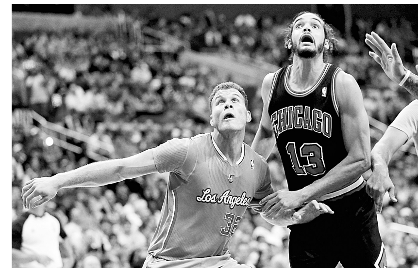
11月24日,快船队球员格里芬(左)与公牛队球员诺阿在比赛中拼抢篮板球。当日,在NBA常规赛中,洛杉矶快船队主场以121:82战胜芝加哥公牛队。

另外,近段时间就延边队队长池忠国传出转会风声,论坛中有球迷已经替建业把池忠国“买”了下来,不过俱乐部方面称:目前与池忠国没有任何接触。