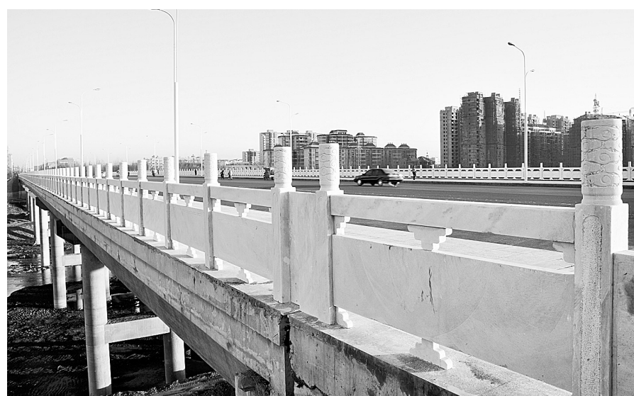
投入使用后的中华南路双泊河大桥。

本报讯(记者 高凯 通讯员 巴明星 黄国勇 文/图)昨日,新郑市组织建设、勘察、设计、监理、施工、监督等部门对该市中华南路新建工程进行检验。经检验,该路段工程及涉及的桥梁顺利通过验收,这标志着中华南路及中华南路双泊河大桥正式投入使用。