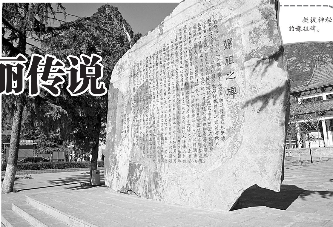
捉拔神秘的螺祖碑。

5月17日,中国民间文艺家协会发函,正式批准荥阳市为“中国螺祖文化之乡”。近日,记者慕名来到螺祖的故乡——荥阳市环翠峪风景区桑梓峪村,探寻背后的故事和文化的渊源。