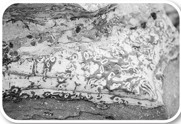
多姿多彩的天锦石。