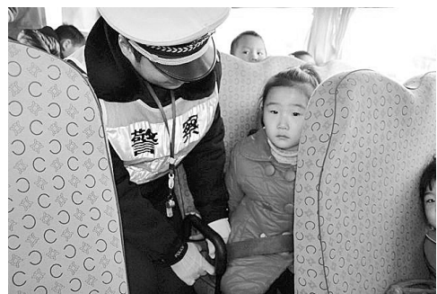
民警正在为小朋友系安全带。

本报讯(记者 张立 通讯员 申建中 靳朝龙 文/图)昨日,新密交警在对运行的校车进行安全检查时,发现不少校车驾驶员和幼儿教师为图方便省事,在幼儿乘车时不为其佩戴安全带,安全带在车上成了摆设。为此新密交警对此进行了严查。