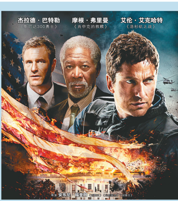
灾难片《奥林匹斯的陷落》月底上映

“中国戏剧奖·小戏小品奖”由中国文联、中国戏剧家协会主办,自1994年创办以来,已连续举办十届,与“梅花表演奖”、“曹禺剧本奖”一样同属“中国戏剧奖”的子项,是全国戏剧界的重要奖项。此次大赛竞争异常激烈,全国共报送小戏小品近1000个剧目。比赛分初评、复评、决赛三个阶段进行,近60个剧目参加了在江苏张家港举办的为期七天的决赛。代表河南参赛的省曲剧团派出了《桑林收子》一剧参加决赛,该剧曾荣获河南省第五届、第六届小戏小品大赛剧目金奖、导演金奖、作曲金奖、表演金奖。比赛中,该剧质朴流畅的唱腔和滑稽幽默的表演赢得了评委和全场观众的一致好评。据悉,全国共有13个小戏和13个小品荣获“优秀剧目奖”。