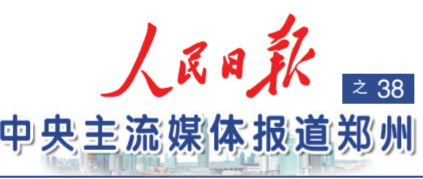
(原载《人民日报》2013年12月12日1版) (人民日报记者 王汉超 整理)