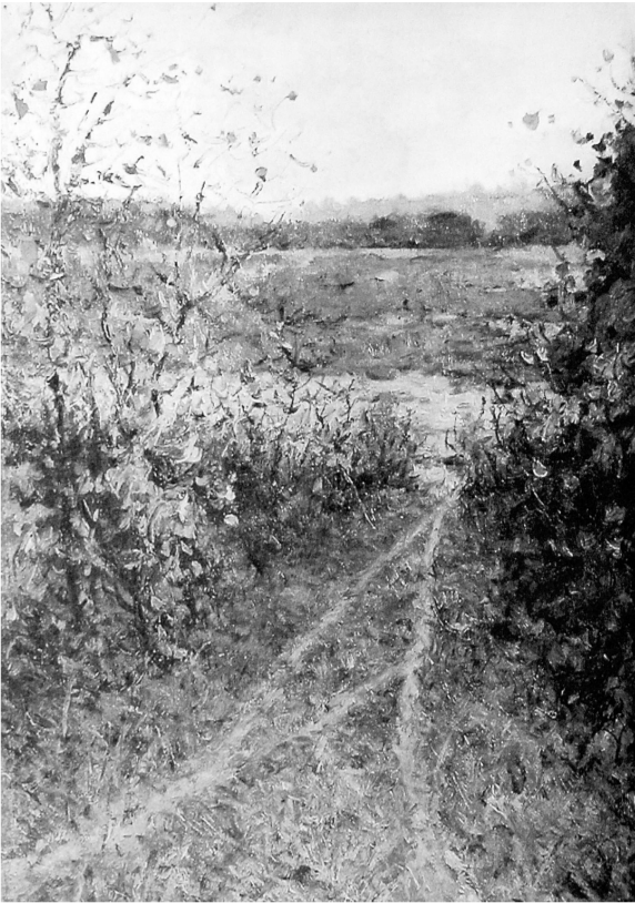
远东的深秋(油画) 刘晓

药不然一边开车，一边跟我说了下这十天来的变化。故宫在沉默许久之后，率先在北京发表公开声明，