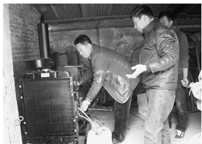
金水区粮食管理中心所辖粮库多处郊区,电力供应不太正常,粮库的排涝、机械通风无法保障,直接危及储粮安全,近日,粮库中心多方筹措资金,为5个国有粮库各配备一台大功率柴油发电机,以备不时之需。

本报讯(记者 李娜 实习生 徐丹丹)昨日上午,社会组织接受政府公益金资助交接仪式举行,共有来自郑州市洗涤行业协会、郑州市康健电子产品研究所、郑州市天泽健康咨询服务中心、郑州市皆福特殊儿童家长互助中心4家社会组织接受了共50万元的福利彩票公益金资助。据了解,此次扶持的社会组织是经郑州市民政局注册登记、贴近民生、开展公益性服务且群众反映较好的社会组织。此次为4家社会组织提供公益金资助,是继去年该市对郑州市发达技校等3家社会组织50万公益金资助活动之后的又一次政府扶持行为。“近年来,随着居民对政府服务需求的日益多元化,有些服务政府可以直接提供群众。但是,也有一些服务,政府即使想提供,因找不到可以提供服务的商业机构,而无法直接实现,比如特殊儿童家庭心理疏导、社区孤寡老人洗衣难问题等。这些服务由于市场太小或专业人员难找,市场上没有能提供服务的商业机构。在这种情况下,政府出资给予社会组织一定的公益金扶持,通过他们来实现政府间接服务群众的功能。”市民间组织管理局相关负责人介绍说。