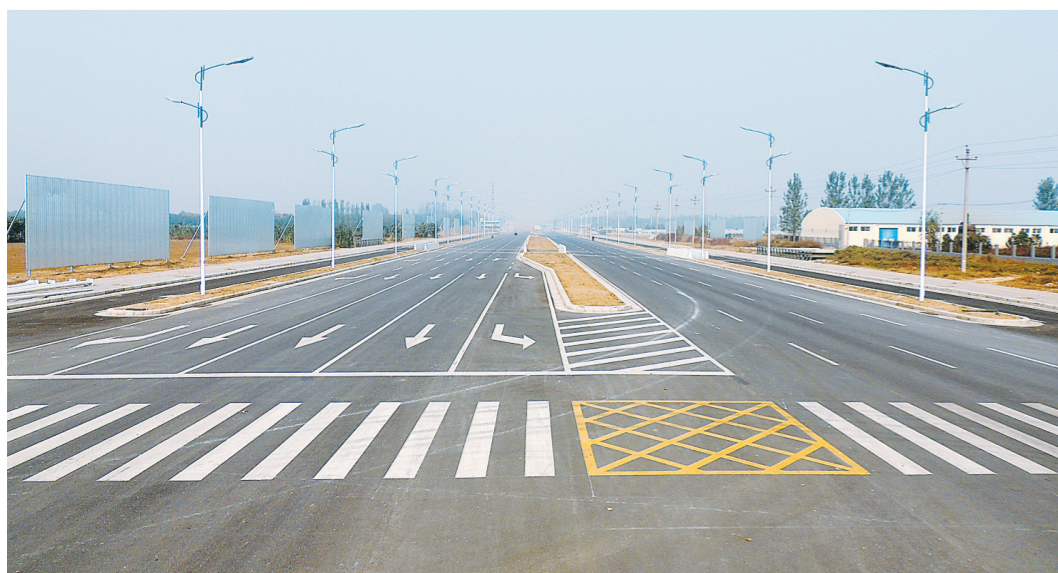
园区主干道基本竣工

目前,国家发改委有关专家正在协助新密市编制环保装备产业园产业发展规划,国家大气污染防治装备专委会10月29日在新密召开,近期,环保装备产业园4个5亿元以上项目已开工建设。