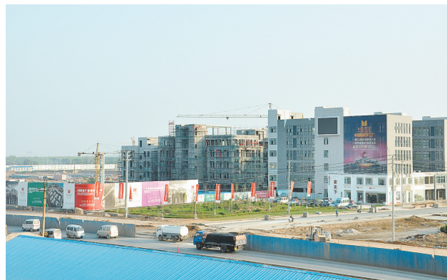
即将完工的锦荣服装创意园