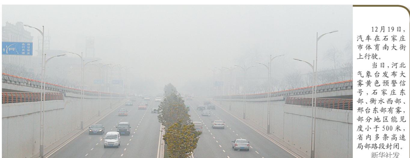
12月19日,汽车在石家庄市体育南大街上行驶。当日,河北气象台发布大雾黄色预警信号,石家庄东部、衡水西部、邢台东部有雾,部分地区能见度小于500米,省内多条高速公路路段封闭。

此外,来自美国、法国、丹麦、以色列、巴西、印度等6个国家的9名外籍科学家今年新当选为中科院外籍院士,其中诺贝尔奖获得者1名。至此,中科院现有外籍院士总人数为72名。中国工程院2013年选举产生了6名外籍院士,其中美国籍4人、澳大利亚籍1人、丹麦籍1人。通过本次增选,中国工程院外籍院士总数增至45人。两院院士增选每两年举行一次。