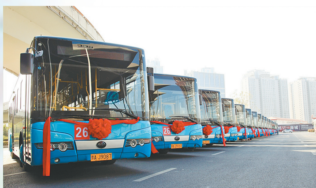
一批批大容量公交车的投入运营,让乘客出行更舒适。