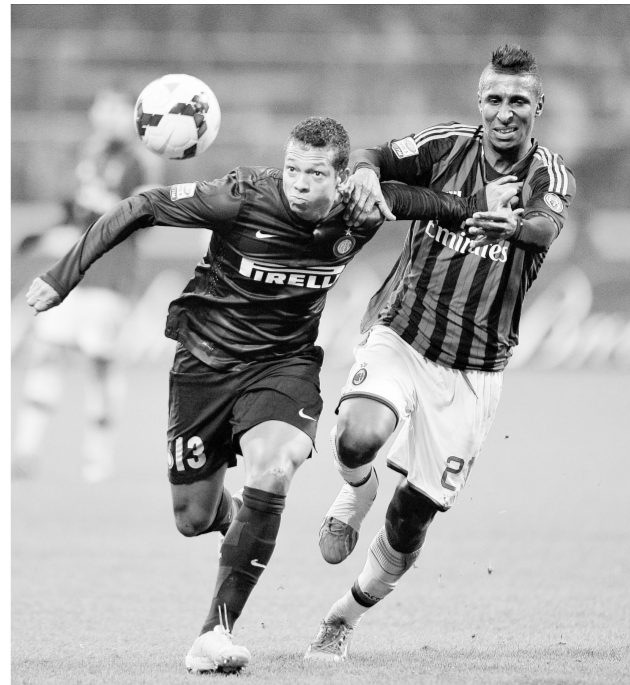
12月22日,国际米兰队球员瓜林(左)与AC米兰队球员康斯坦特在比赛中拼抢。当日,在意大利足球甲级联赛第17轮比赛中,国际米兰队以1:0战胜AC米兰队。