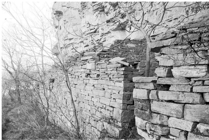
依山而建的石房依然很规整。