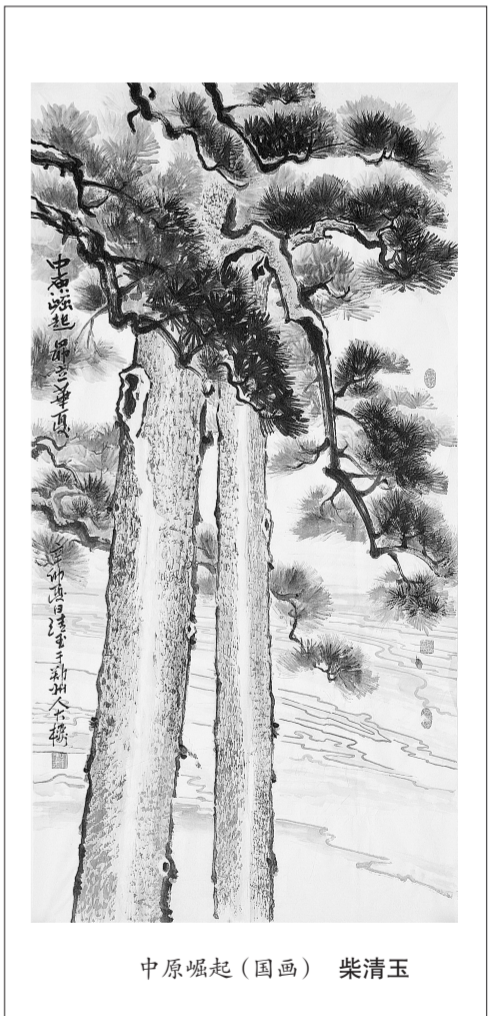
中原崛起(国画) 柴清玉