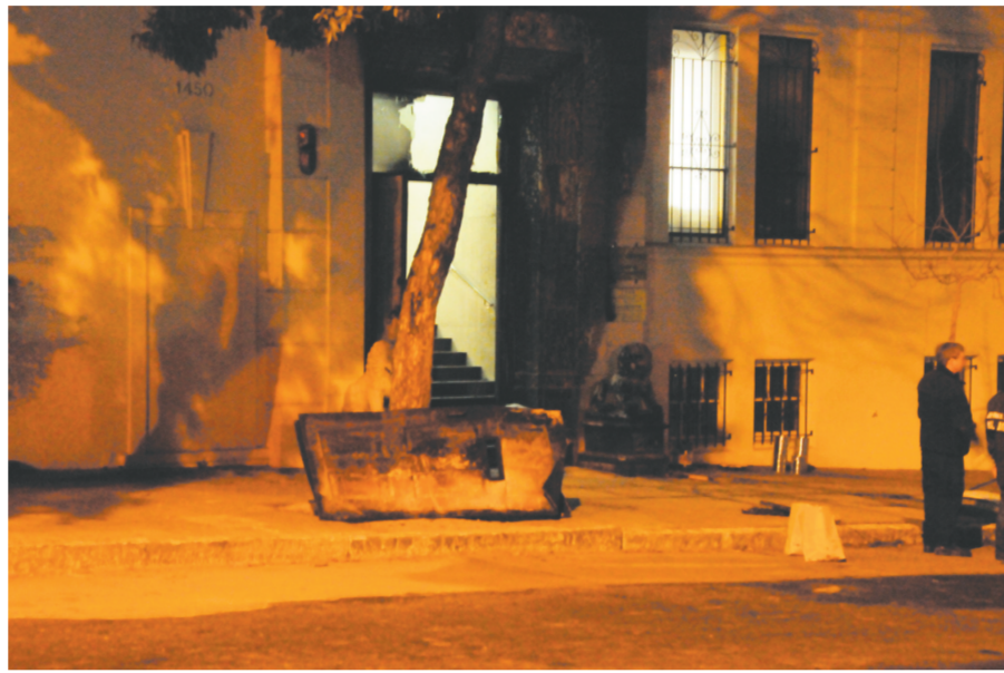
1月2日凌晨,中国驻旧金山总领馆损毁的大门被拆卸后放在地上。

旧金山警察局派出警车和警员,封锁总领馆正门所处街道的整个路段。 总领馆正门紧邻街道,由两扇大门组成,其中一扇严重损毁。正门前的两个白色石雕狮子,右侧一个呈焦黑色。目前,美方多部门执法人员连夜作业,收集证据、摄取图像。 总领馆新闻发言人说,领馆方面已向美方提供安全监控录像,帮助侦破案件。 总领馆方面认定,这起纵火案针对中国驻美国领事机构,严重损毁领馆设施,威胁馆员和周边居民安全,是一起恶性破坏事件。中方已向美方交涉,敦促美方切实履行职责,保护中方馆舍和人员安全并迅速破案,将凶犯绳之以法。