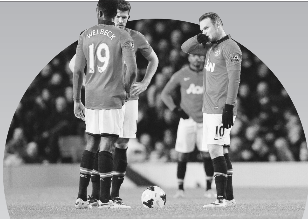
曼联队球员在比赛中。

另据了解,此次“谁是球王”河南赛区总决赛为期两天,最终获得总决赛6个竞赛大项冠军的选手将加冕“河南羽球之王”,同时还代表河南省参加2013年“谁是球王”中国羽毛球民间争霸赛华北大区赛。