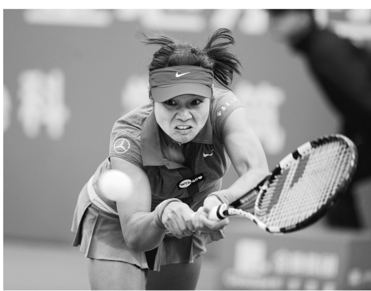
1月2日,李娜在比赛中。当日,在第二届WTA深圳网球公开赛女子单打四分之一决赛中,中国选手李娜以2:1战胜罗马尼亚选手莫妮卡·尼库莱斯库,晋级半决赛。