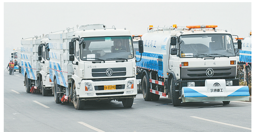
全市机械化清扫率已达五成。

城市的快速发展,考验着城市的管理能力。为了破解城市管理难题,去年以来,市委、市政府在强力推进新型城镇化建设六个切入点的基础上,抓住群众反映强烈的突出问题,确定并实施了规范养犬管理、变电站落地建设等十二项专项治理,一大批群众关心的热点难点问题得到有效解决。