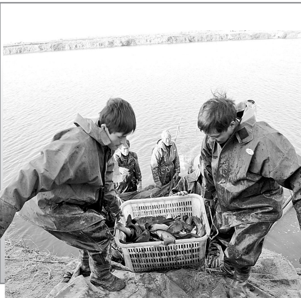
昨日，记者被称为“鱼米之乡”的荥阳王村镇黄河滩区养殖基地看到，渔民正在因网捕鱼发往市场。据镇工作人员介绍，这里紧靠黄河滩区，非常适合养殖，这里水产养殖面积已当初的200多亩发展到了1.8万亩，成为河南省最大的无公害淡水鱼养殖基地，全国最大的黄河鲤鱼连片养殖基地。成立的养殖专业合作社目前会员已达1000多人，有力地促进了当地群众增收。

扩大日产、海马、红宇整车生产能力，引进整车和汽车零部件生产企业，促进汽车产业链向纵深延伸，逐步形成了整车和汽车零部件协调配套、龙头企业与配套企业共同发展、汽车服务贸易不断完善的现代汽车产业体系。去年，集聚区内承接产业转移签约项目7个，其中天津宇傲集团有限公司投资1亿元的郑州宇傲汽车零部件项目、上海派斯汽车车身模具有限公司投资2亿元的上海派斯汽车车身模具项目、东风日产乘用车有限公司投资30亿元的东风日产发动机中牟工厂项目都已经建成投产。