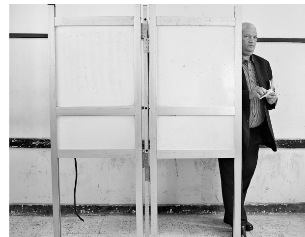
在开罗的一投票站，一名市民参与新宪法草案公投。

据新华社开罗14日迎来持续两天的新宪法草案全民公投。一些政治分析师认定，这一政治“大考”可能成为这个中东地区大国政治过渡的“拐点”，直接影响埃及今后政局走向。不过，这一重要事件以一枚小型自制炸弹爆炸拉开序幕。埃及警方证实，投票正式开始前，一枚小型炸弹在首都开罗一家法院门前爆炸，损坏这座建筑物正面，所幸没有造成人员伤亡。