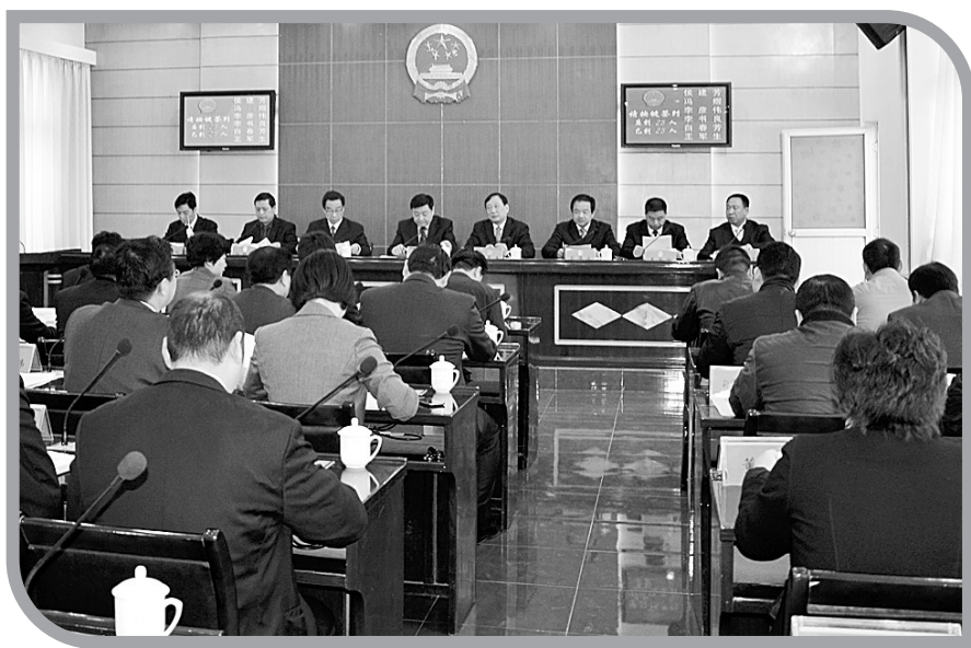
人大常委会会议现场。代表到郑州正力聚合物科技有限公司视察。

具体做法:要加强基层人大之间的业务交流,坚持和完善街道、乡镇人大代表例会制度,多方面为乡镇、街道人大主席(主任)参加培训创造条件,不断提高基层人大履职水平。