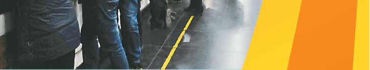
不少服务窗口精简审批手续,提高办事效率。

据统计,12月份,通过全市电子监察系统监测,全市40个保留审批职能的部门累计受理业务49114项,未发现有超时办结、层层审批现象。一个工作日内办结37980项,占77.3%;在承诺期限内提前办结34902项,占71.1%。