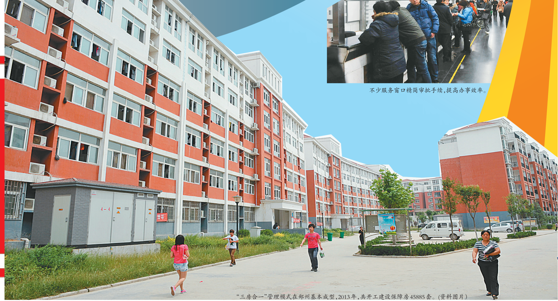
“三房合一”管理模式在郑州基本成型,2013年,共开工建设保障房45885套。(资料图片)