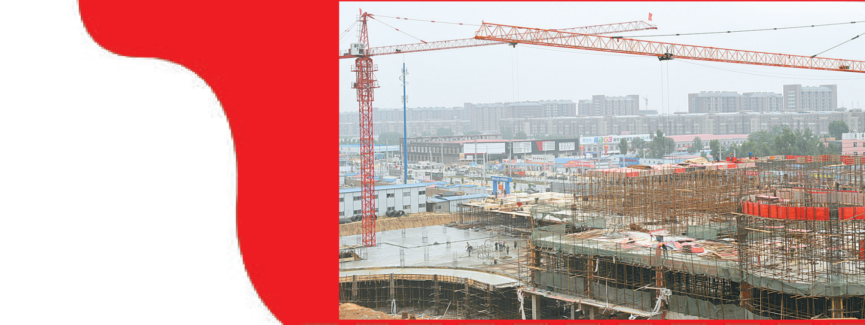
郑州航空港区建设如火如荼。2013年11月份,省政府办公厅出台“直通车”制度,赋予郑州航空港区省辖市一级经济和社会管理权限,减少行政层级,提高行政效率。

对于企业经营范围审批登记条件,也大大放宽。许可经营项目,一律实行先照后证。工商机关为其核发营业执照期限为半年的营业执照用于项目筹建,取得许可并换发营业执照后方可经营。不再限制企业首次出资额及比例。