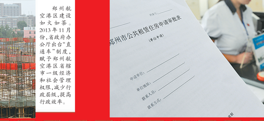
郑州市公共租赁住房申请审批表

再次,解决住房困难的时间更快了。以前,申请不同种类保障房需要经过不同部门审批,有些申请审核时间甚至长达半年。“三房合一”之后,郑州公租房申请审核时间最长60天,外来务工人员、新就业职工则不管采