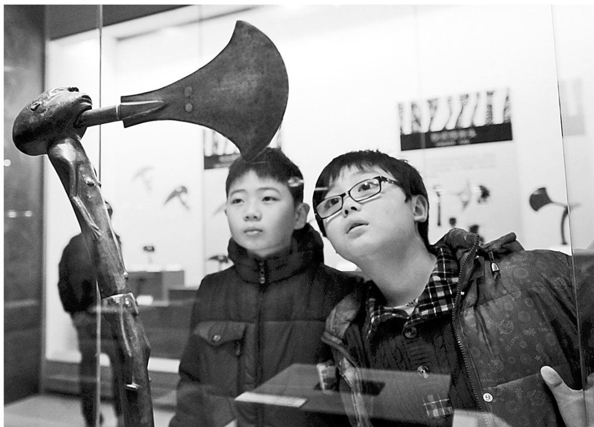
省博物院内,两位小朋友被来自中部非洲的古朴兵器所吸引。