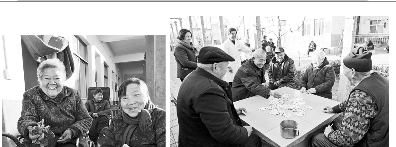
在冬日温暖的阳光中打牌，真的挺乐呵。

届时，康百万庄园将开展“梦想马上成真”、“马上送红包”、“猜谜语”、“对春联”等活动。浮戏山雪花洞将举办“闹新春送祝福、同撞新年福钟、新年大转运、福炮抢先放”活动。杜甫故里将推出“新春红包送不停”等活动。除夕之夜，石窟寺景区将举行“祈福钟声迎新春”、“猜谜语”等活动。