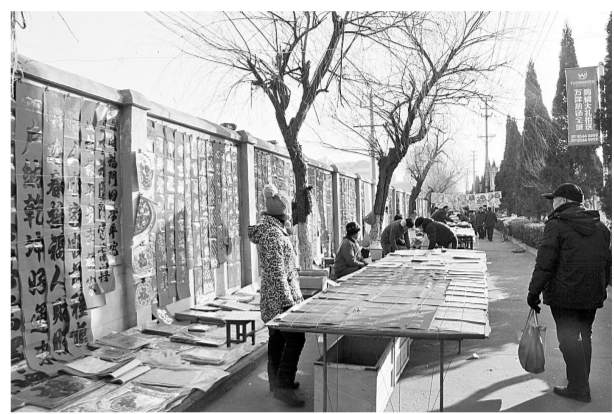
图为年味十足、规划齐整的马路市场。

此外，为了提升环境空气质量，巩义市区今年不再设置鞭炮市场，对于临时市场及周边流动兜售、未经许可非法占道和露天经营烟花爆竹行为，将进行严惩。巩义市还号召市民，尽量少燃放烟花爆竹，为城市创造出更多的碧水蓝天。