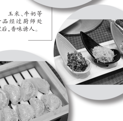
玉米、牛奶等食品经过厨师处理后，香味诱人。