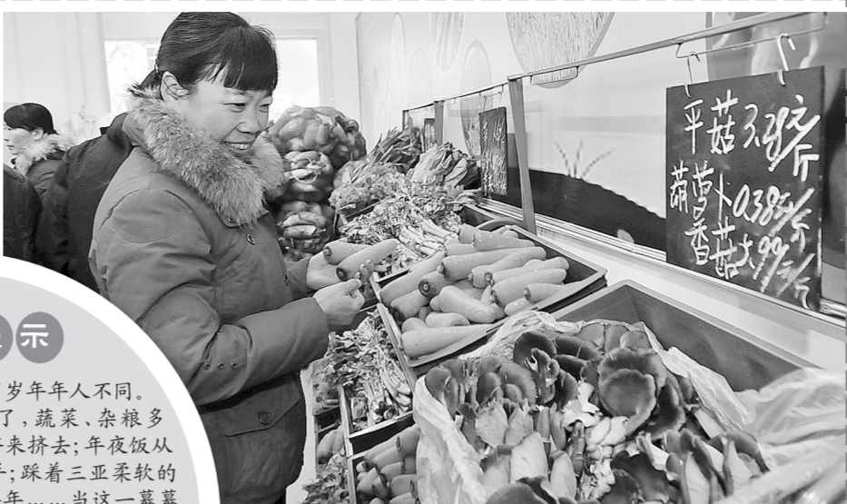
逢年过节，有越来越多吃惯了大鱼大肉的市民，开始青睐豆腐、萝卜、白菜、香菇等蔬菜。

年年岁岁花相似，岁岁年年人不同。市民餐桌上的肉少了，蔬菜、杂粮多了；回家不用再扛着行李来挤去；年夜饭从下馆子再次回归到全家动手；踩着三五朵柔软沙滩通过微信向亲朋好友拜年……当这一幕幕细微的经济生活变化汇成一道美丽的节日风景，你会发现，与岁月年轮一起变幻的，不仅有似水流年，还有人们的消费习惯和过年方式。过年之所以让人心生向往，乃是因为：正是在“变与不变”中，绿城人的经济生活更加时尚、健康、多元。而万千变化中，唯一不变的，是人们对健康、快乐生活的永恒追求。