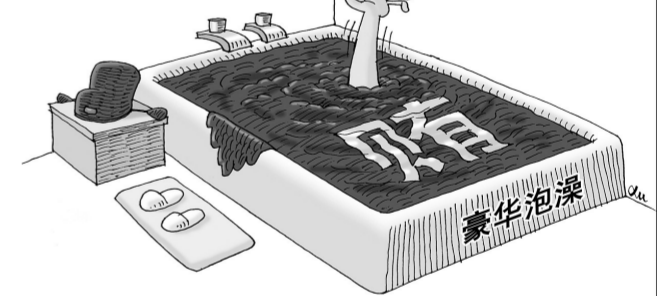
泥沼