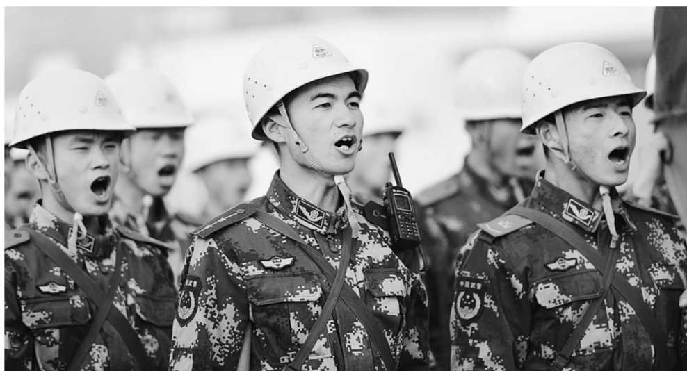
受灾情况 震中乡村无人员伤亡

据国家地震台网测定,北京时间2014年2月12日17时19分,在新疆维吾尔自治区和田地区于田县(北纬36.1度、东经82.5度)发生7.3级地震,震源深度约12公里。震中距离于田县城约110公里,距民丰县城约100公里,距和田市区约250公里,距乌鲁木齐市约970公里。震中30公里范围内平均海拔约5100米。 据初步了解,于田县城、民丰县城均有明显震感,11日,于田地区就曾连续发生3次3级以上地震,最大震级5.4级。2008年3月21日,该地区附近曾发生7.3级地震,无人伤亡。