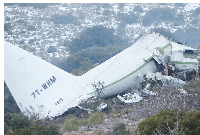
图为2014年2月12日拍摄的坠机现场照片。

据新华社阿尔及尔2月12日电(记者 黄灵)阿尔及利亚国防部12日证实,11日发生在阿东部乌姆布瓦吉省的军用飞机坠毁事故造成77人死亡,一名21岁的士兵获救后送医,搜救行动已于11日深夜结束。