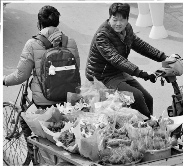
▶流动花车