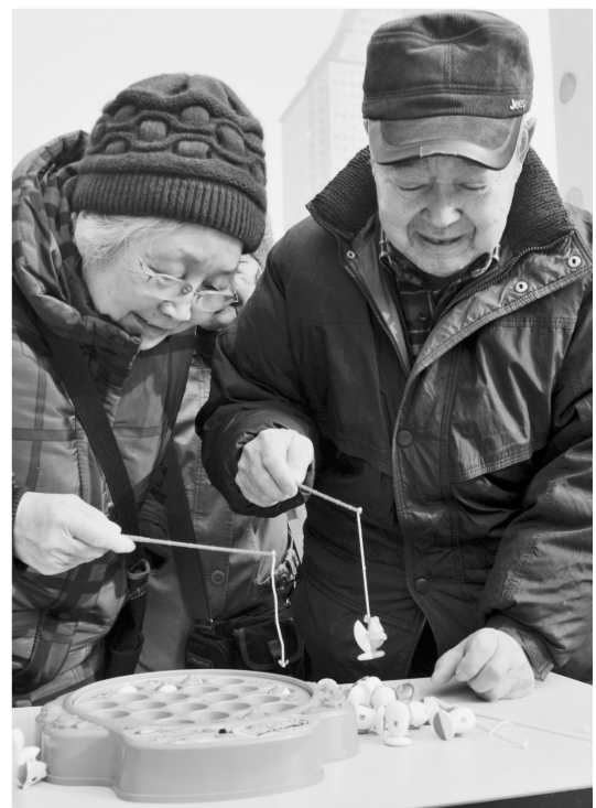
昨日,市老干部活动中心举办市直机关老年人元宵节游艺活动。在欢声笑语中,老人们兴致勃勃地参加了猜谜语、钓鱼等10多项趣味活动。

车行驶到东百炉屯站时,猜灯谜活动进入高潮:“爱好旅游”打一成语,是喜出望外。”市民刘先生一下子就猜中了谜底,脱口而出。“四个晚上”打一字,李先生挠了挠头,“应该是‘罗’吧。”接连两名乘客猜中了谜语,他们欣喜地向车队的青年志愿者们兑换了两份礼品——红灯笼。车上一位九岁小姑娘月月也不甘示弱,猜中了一个谜语后,她高兴地拿着小礼物——象征福祿寿的葫芦又蹦又跳。一路上,200多条谜语被乘客揭了谜底,200多份小礼品分发了给乘客。