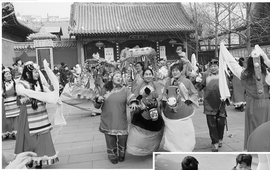
▲昨日,管城区在文庙广场、城隍庙等处举办优秀民间文化集中展演。

当日上午,市口腔医院在人民公园举行“元宵节关注农民工”大型义诊活动,通过悬挂条幅、发放宣传资料、免费进行口腔检查、指导等,让广大农民工了解更多的口腔保健知识。